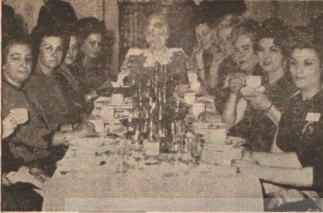
Eski usul düünler düzenleyen Türk -Amerikan kadınlar derneği üyeleri