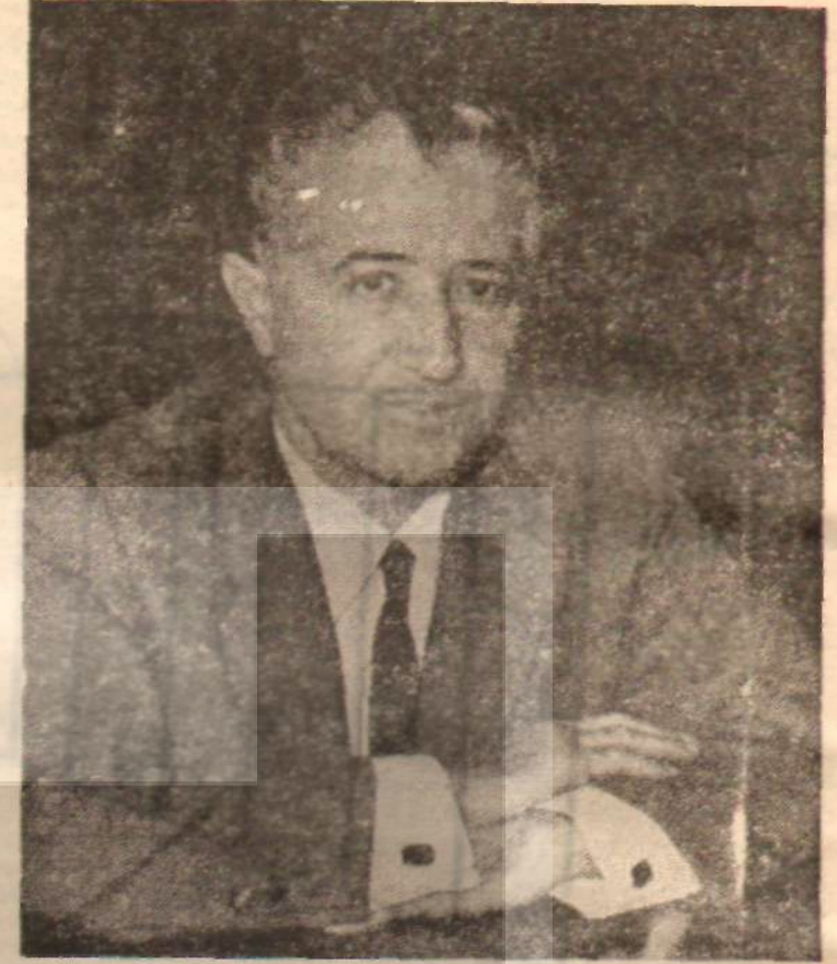
BAYINDIRLIK BAKANİ HİKMET ONAT Bürokrasinin kuvveti

Denilebilir ki, işler büyük tutulmuştur, fakat bu iddia da ufak bir incelemeye dayanmayacak kadar çürüktür. Zira yapılan hesaplar, yol hizmetindeki artış hızının milli gelir artış hızından 0.2 misli fazla olduğunu ortaya koymuştur. Bu hesaba göre, milli gelir ortalamaya yüzde 7 artarsa, mevcut trafik hacmi 10 yılda bir misli artacak, yolların ortalama kullanılması için 10 yıl sonra ancak yüzde 28'e çıkacaktır. Yolların tam kullanılması için 60 yıl beklemek gerektir. Halbuki bir yolun ömrü 20 yıldır. Demek ki yol, görebileceği hizmetin ancak üçte birini görerek ömrünü tamamlayacaktır. Karayolları yetkilileri de, bu yanlış politikaların farkındadırlar. Nitekim bugünkü Karayolları Genel Müdürü özel konuşmalarında şu hikâyeyi anlatır: «Konyadan Ankara'ya geliyordum. Yolda otostop yapan bir turist arabama aldım. İngilizmiş. Turist bana memleketinde bile bu kadar güzel yolun az olduğunu söyledi. Fakat iki saatir yolda bekliyordum, her iki taraftan da tek bir taşıt geçmemiş. Doğrusu utandım ve utancımın turistte Karayolları Genel Müdürü olduğumu söyledim»